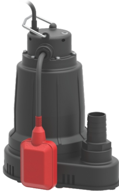
GMP bomba con interruptor flotante de ángulo ancho GMP pump with wide angle float switch Pompe GMP avec interrupteur à flotteur d'angle grand